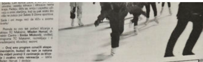
Prema su ovo tek počeli ključni... (text continues)